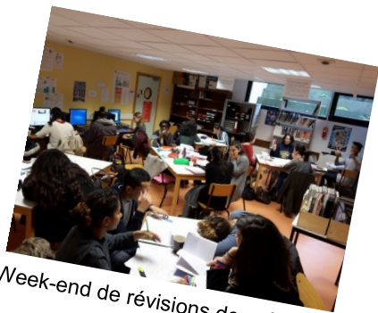
Week-end de révisions des 1 e et T le

Un groupe scolaire à la recherche de l'excellence !