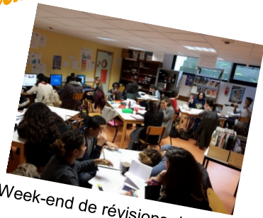
Week-end de révisions des 1 er et T er

Un groupe scolaire à la recherche de l'excellence !