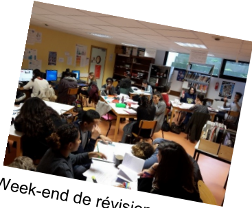
Week-end de révisions des 1 er et T er

Un groupe scolaire à la recherche de l'excellence !